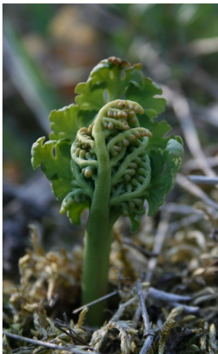
Ung rutlåsbräken i Sandbacken, Söderbärke.

Idre, Gundagssätern 500 m N om, gammal grustagsbotten, 8 fertila ex, 2020 (LBr)