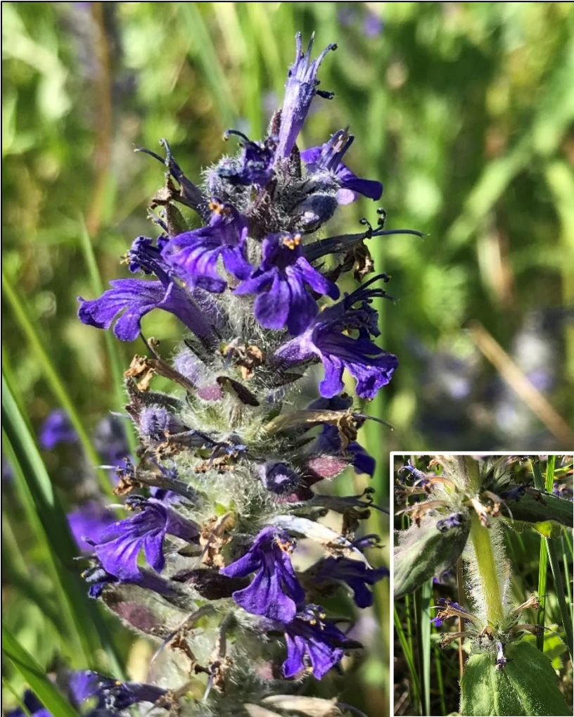
Kritisugan vid Avesta Storfors kraftstation fotad av Peter Klintberg.