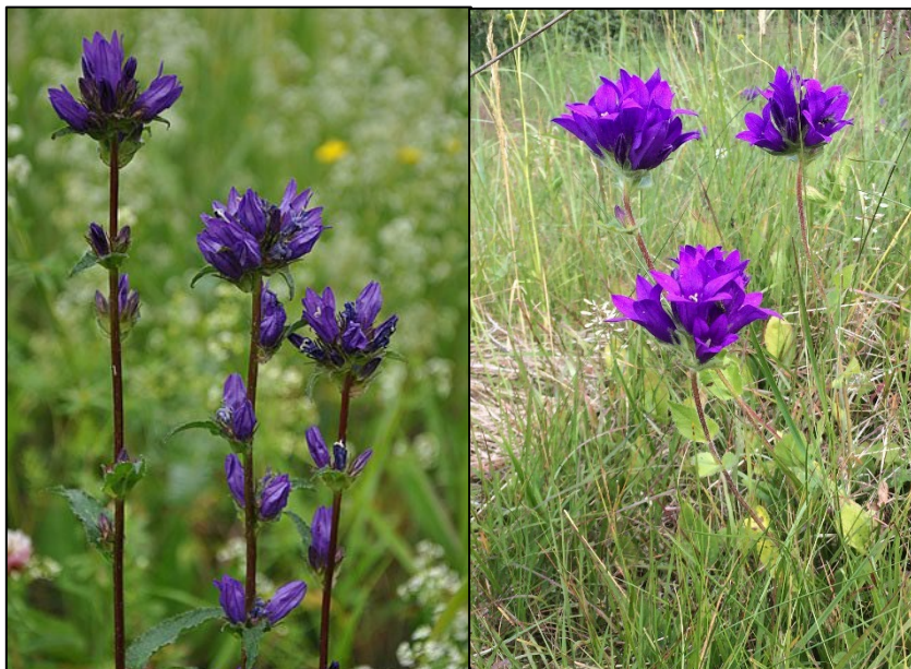
Ssp. glomerata (t.v.) och "Superba" (t.h.)

Toppklockan som sådan är först omnämnd från Dalarna så sent som 1861.