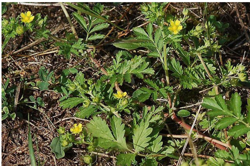
Kvarnfingerörten i Savelgärdet