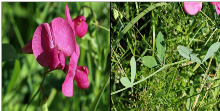
Knölvialen i Islingbybacken, den jämte förekomsten i Björnhyttans sopstation enda aktuella från 2000-talet i Dalarna.