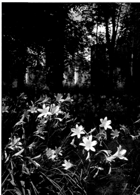
Dagliljorna med kolhusruinen bakom.

Vid en noggrannare undersökning av holmarna kanske ytterligare någon gammal gömd trädgårdsväxt kan hittas.