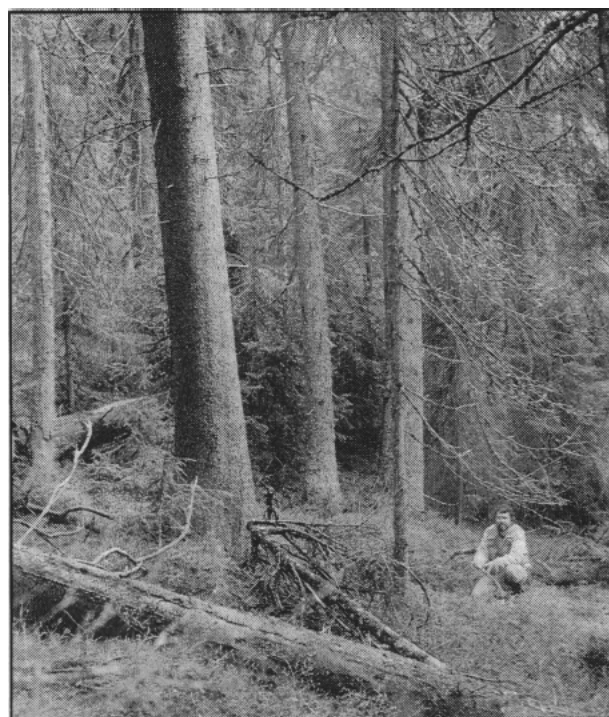
Lasse Wikars i den gamla granskogen vid Bjurdammsberget.

Att området ligger precis intill reservaten Stopån/Anjosvarden och Våmhuskölen gör inte värdet mindre utan större. Att koppla samman det här beskrivna området med dessa reservat vore utan tvivel den bästa lösningen.